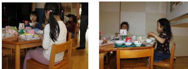
幼児組の食事の風景です。しっかり背筋を伸ばし、正しい姿勢で椅子で腰かけています。