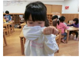
咳エチケットのお話の様子です。