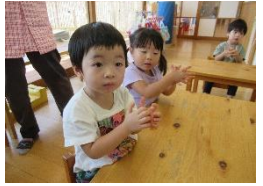
歌に合わせて手洗いの練習をしています。